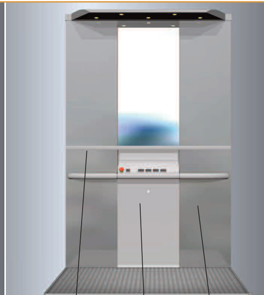
Dzielona obudowa pleców platformy RAL 7035 RAL 9007