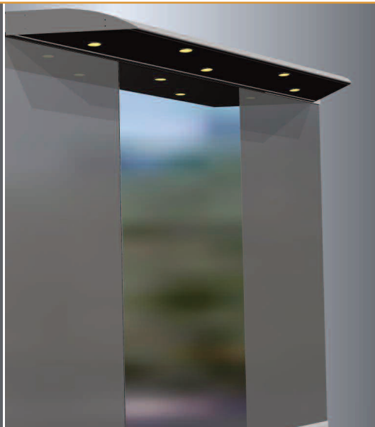
Oświetlenie żarówkami LED & licowane lustro